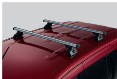
BARRES DE TOIT KE73000QKO

Créez encore plus de rangement pour de plus grandes aventures, avec de l'espace pour les vélos, les skis, les planches de surf, les coffres de toit et plus encore.