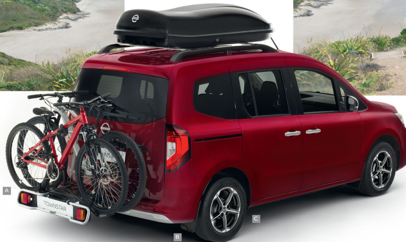
A - PORTE-VÉLOS KE73880100

Pour transporter plusieurs vélos en toute sécurité.