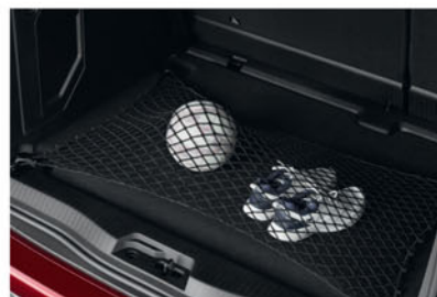
FILET HORIZONTAL KS96674R00

Laissez vos animaux domestiques voyager dans le confort et en toute sécurité, séparés de l'habitacle et des passagers, grâce à la grille de séparation Nissan.