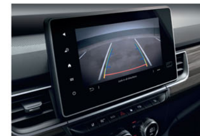
CAMÉRA DE REcul KE28900QK1

Pratique, confortable et facile à conduire, - la toute nouvelle Nissan Townstar Combi a été conçue pour celles et ceux qui ont une vie bien remplie. Préservez son habitacle de l'usure grâce à une gamme d'accessoires de protection intérieure disponibles, ainsi que des options de visibilité arrière améliorées.