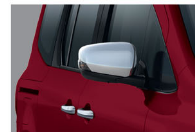
POIGNÉE DE PORTE KE96800QK0 COQUES DE RÉTROVISEURS KE96000QK0

L'accoudoir rabattable pratique offre un confort accru sur les longs trajets.