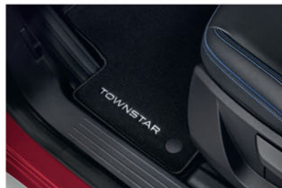
TAPIS DE SOL EN VELOURS KE74500QK1

Pour une protection intérieure avec une finition élégante.