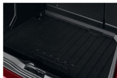
REVÊTEMENT DE COFFRE KE96500QK1

Protection pour le plancher et les côtés avec un revêtement de coffre Nissan, pour une tranquillité d'esprit totale.