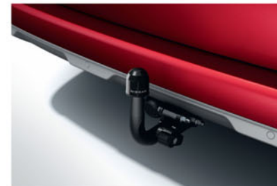
BARRE D'ATTELAGE AMOVIBLE KE50000QKF

Une capacité de remorquage quand vous en avez besoin. Un look propre et élégant quand vous n'en avez pas besoin. La barre d'attelage amovible en option offre le meilleur des deux mondes.