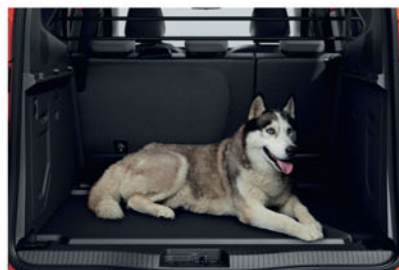
GRILLE DE SÉPARATION KE96800QKC

Pour les escapades plus longues, augmentez rapidement et simplement votre espace de chargement avec un coffre de toit Nissan.