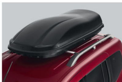
COFFRE DE TOIT KE734480BK

Pour les escapades plus longues, augmentez rapidement et simplement votre espace de chargement avec un coffre de toit Nissan.