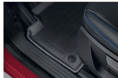
TAPIS DE SOL CAOUTCHOUC KE74800QK1

Pour une protection intérieure avec une finition élégante.