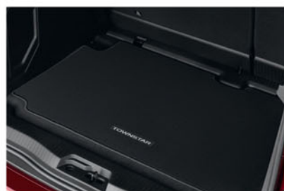
TAPIS DE COFFRE KE84000QK1

Protection pour le plancher et les côtés avec un revêtement de coffre Nissan, pour une tranquillité d'esprit totale.