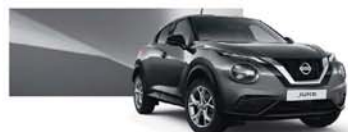
Gunmetal Grey (M) - KAD