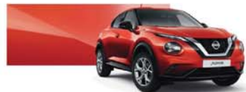
Fuji Sunset Red (M) - NBV