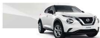
Solid White (S) - 326