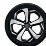
Jantes en alliage 19"