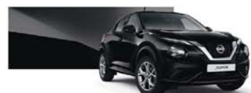
Enigma Black (M) - Z11