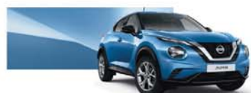
Vivid Blue (M) - RCA