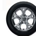
Jantes en alliage 17"