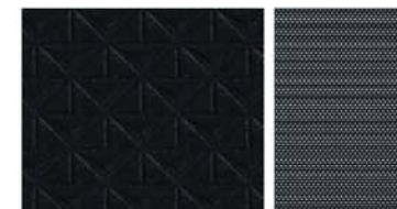
N-CONNECTA ET N-DESIGN STANDARD Tissu Noir/Tissu Noir