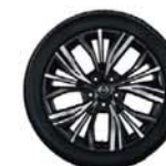
Jantes 19" Akari