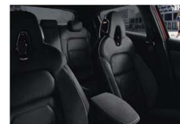
PACK N-DESIGN - CHIC BLACK - EN OPTION Enigma Black / Sellerie mixte Cuir & Alcantara®