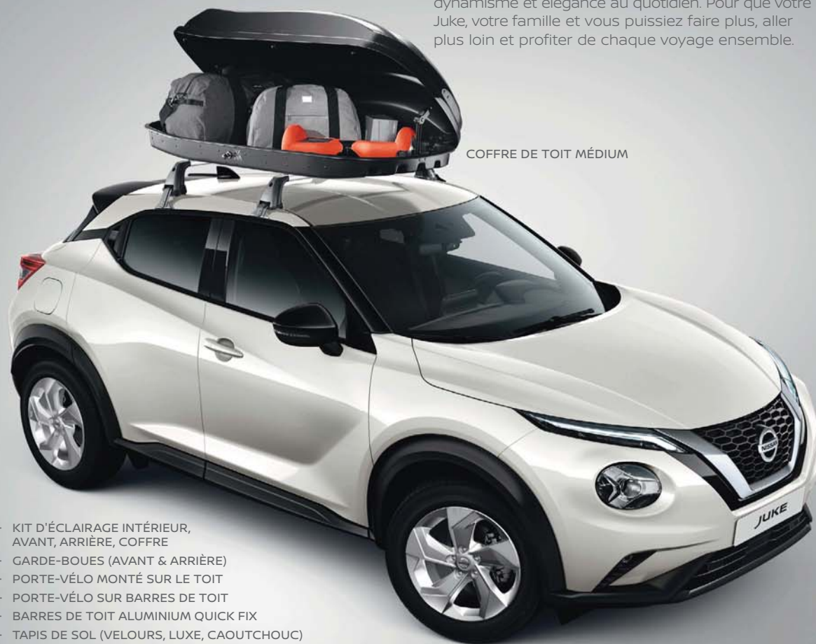
COFFRE DE TOIT MÉDIUM

À l'instar de votre JUKE, sa gamme d'accessoires est conçue pour vous apporter technologie, dynamisme et élégance au quotidien. Pour que votre Juke, votre famille et vous puissiez faire plus, aller plus loin et profiter de chaque voyage ensemble.