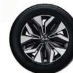
Jantes 17" Sakura Design