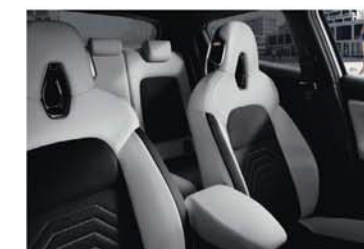
PACK N-DESIGN - LIFESTYLE WHITE - EN OPTION Gris clair / Sellerie mixte tissu / TEP