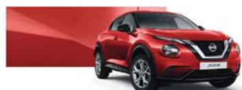
Solid Red (S) - Z10