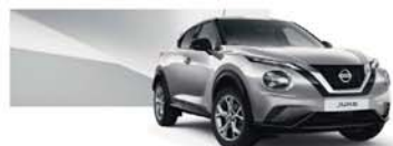
Platinum Silver (M) - KYO