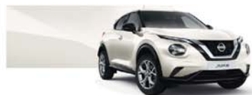
Pearl White (P) - QAB