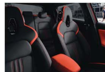
PACK N-DESIGN - ACTIVE ORANGE - EN OPTION Energy Orange / Sellerie mixte cuir & TEP