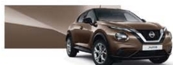
Chestnut Bronze (M) - CAN