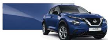
Ink Blue (M) - RBN