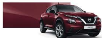
Burgundy (M) - NBQ